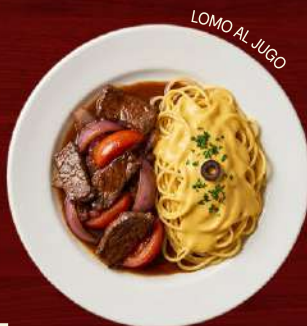
LOMO AL JUGO

Pasta coated in a creamy aji amarillo and cheese sauce—smooth, bold, and gently spicy.