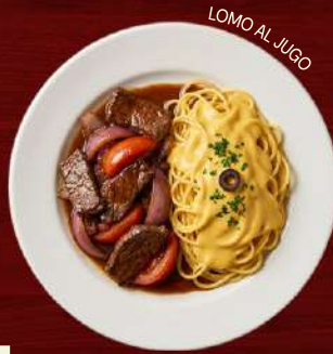
LOMO AL JUGO

Pasta bañada en una cremosa salsa huancaína hecha a base de ají amarillo y queso, un clásico sabor peruano de textura suave y ligeramente picante.