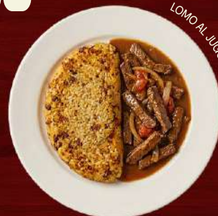
LOMO AL JUGO

A classic Afro-Peruvian dish made from rice and beans pressed and seared until golden—crispy outside, soft inside.