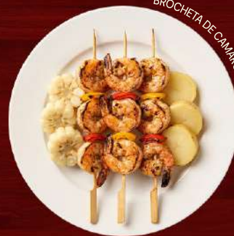
BROCHETA DE CAMARÓN