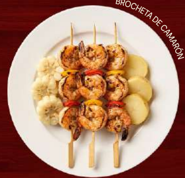
BROCHETA DE CAMARÓN