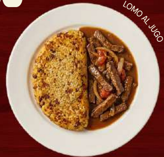
LOMO AL JUGO

Plato afroperuano a base de arroz y frijoles previamente cocidos, integrados y salteados a alta temperatura hasta formar una base compacta, dorada y crujiente, con interior suave y sabor profundo.